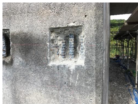
健全部への適用例（部分はずり）