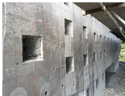
健全部への適用例（部分はずり）